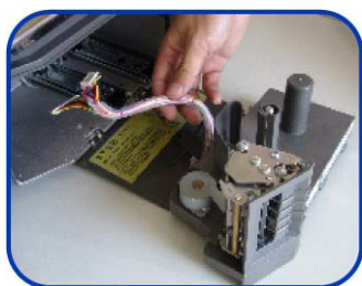
laka zamjena sklopa pisača